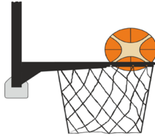
Διάγραμμα 3. Μπάλα μέσα στο καλάθι

31-20 Κατάσταση Είναι παράβαση παρέμβασης (basket interference) εάν ένας αμυνόμενος παίκτης αγγίζει τη μπάλα ενώ η μπάλα είναι μέσα στο καλάθι.