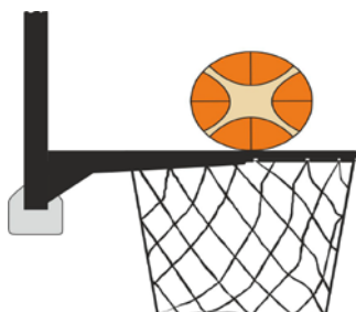
Διάγραμμα 2. Η μπάλα σε επαφή με τη στεφάνη

31-15 Κατάσταση: Η παράβαση παρέμβασης (basket interference) σημειώνεται από έναν αμυνόμενο ή επιτιθέμενο παίκτη κατά τη διάρκεια μιας προσπάθειας για καλάθι όταν ένας παίκτης αγγίζει το καλάθι ή το ταμπλό ενώ η μπάλα είναι σε επαφή με τη στεφάνη και έχει ακόμα τη δυνατότητα να εισέλθει στο καλάθι.