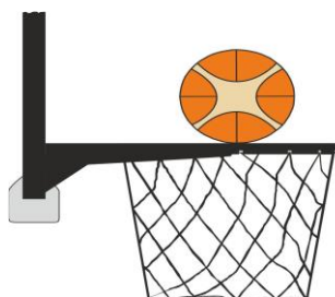
Διάγραμμα 3. Η μπάλα είναι σε επαφή με τη στεφάνη

31-18 Κατάσταση: Η παράβαση παρέμβασης (basket interference) σημειώνεται από έναν αμυνόμενο ή επιτιθέμενο παίκτη κατά τη διάρκεια μιας προσπάθειας για καλάθι όταν ένας παίκτης αγγίζει το καλάθι ή το ταμπλό ενώ η μπάλα είναι σε επαφή με τη στεφάνη και έχει ακόμα τη δυνατότητα να εισέλθει στο καλάθι.