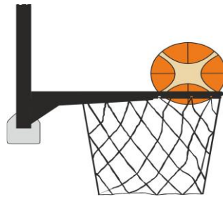
Διάγραμμα 4. Μπάλα μέσα στο καλάθι

31-23 Κατάσταση Είναι παράβαση παρέμβασης (basket interference) εάν ένας αμυνόμενος παίκτης αγγίζει τη μπάλα ενώ η μπάλα είναι μέσα στο καλάθι.