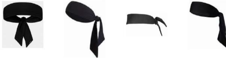
Διάγραμμα1. Παραδείγματα κορδελών κεφαλής

4-4 Κατάσταση. Το να φορούν (οι αθλητές) κορδέλες τύπου φουλάρι, δεν επιτρέπεται.